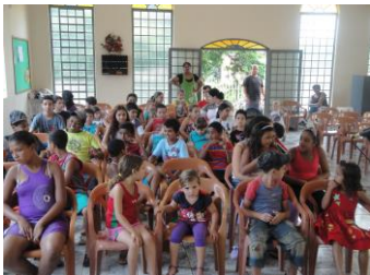
Proj. Ev. TARDE ALEGRE