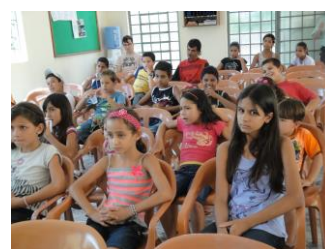
Proj. Ev. TARDE ALEGRE