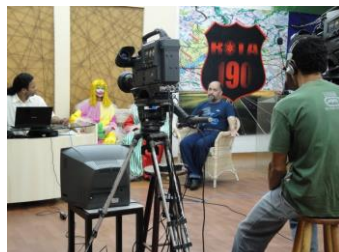
Entrevista ESPAÇO ABERTO