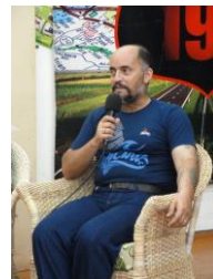
Prog. Espaço Aberto