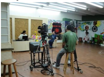
Programa Espaço Aberto