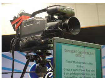
Bastidores do Programa O Caminho da Vida