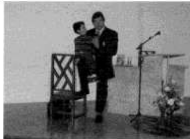
Colégio Presbiteriano XV de Novembro. Falei com todas as crianças da Educação Infantil e do Ensino Fundamental I. no dia 24 de Abril.