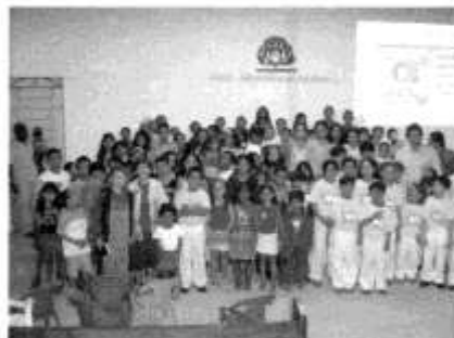
Mensagem na Quarta Igreja de Garanhuns