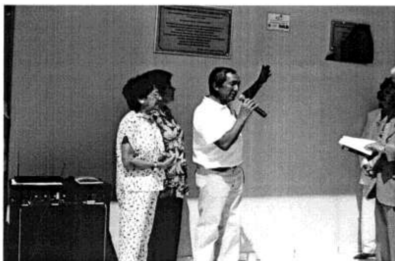
Placas do Complexo Presbiteriano