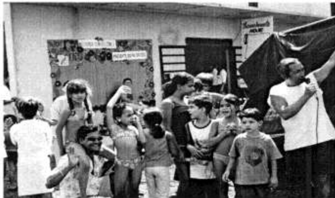
Programação das Crianças no Complexo Presbiteriano de Cultura e Lazer