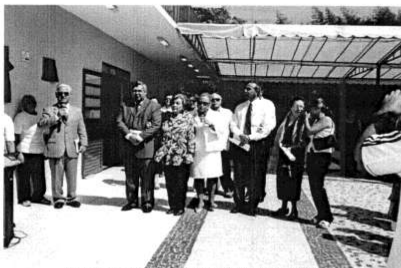
Inauguração do Complexo Presbiteriano de Cultura e Lazer