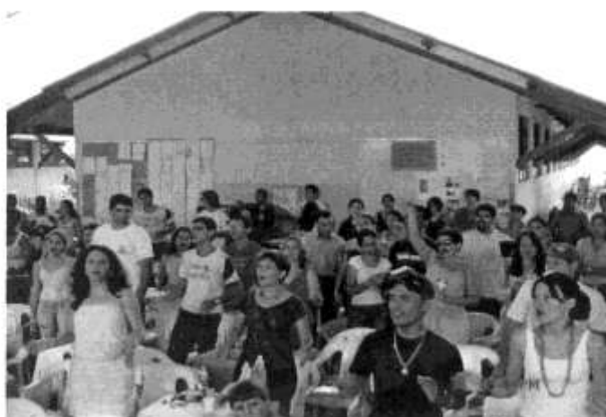
Uma parte do auditório vibrante no Encontro da Confederação de Mocidade do Noroeste do Brasil, em Jaru - RO Outubro de 2006