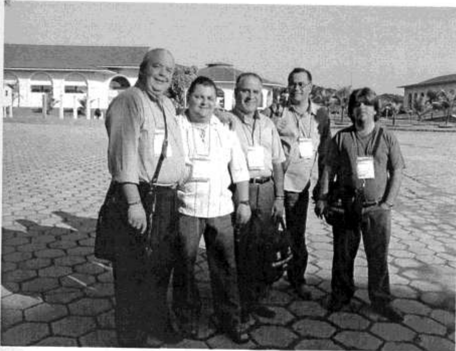
Com representantes do Presbitério Norte Caxiense, na RO do SC-IPB , Aracruz – ES, em Julho de 2006