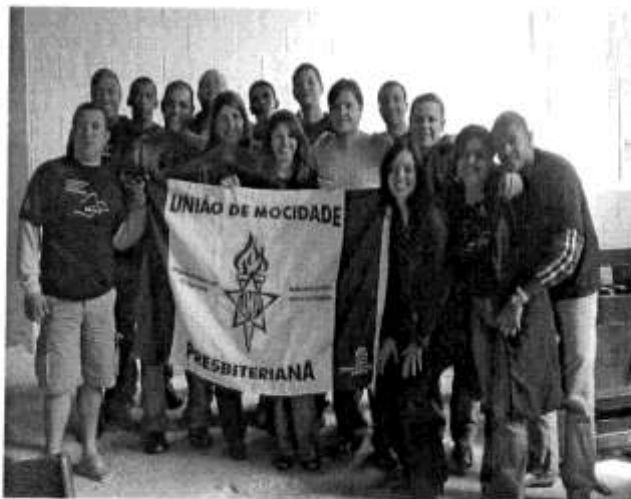
Representantes das sinodais na Reunião da Comissão Executiva da CNM – Agosto de 2006 – Cotia - SP