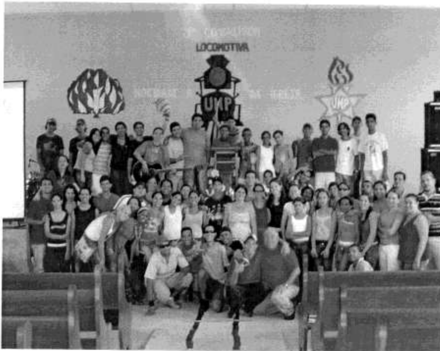
Os participantes do Congresso da Federação Oeste Matogrossense, em Araputanga – MT – Novembro de 2006