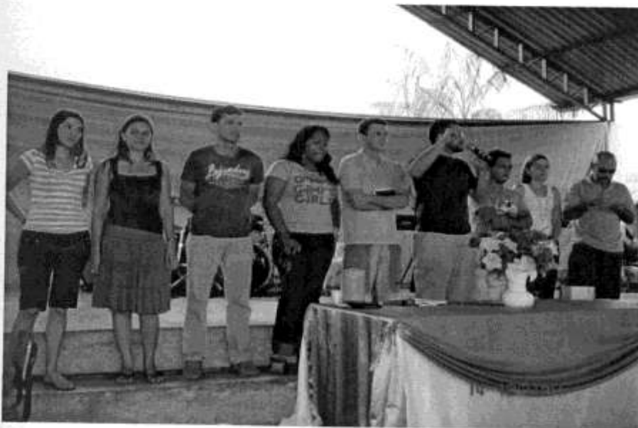
Executiva da Sinodal Noroeste do Brasil, em Jaru-RO, em Outubro de 2006