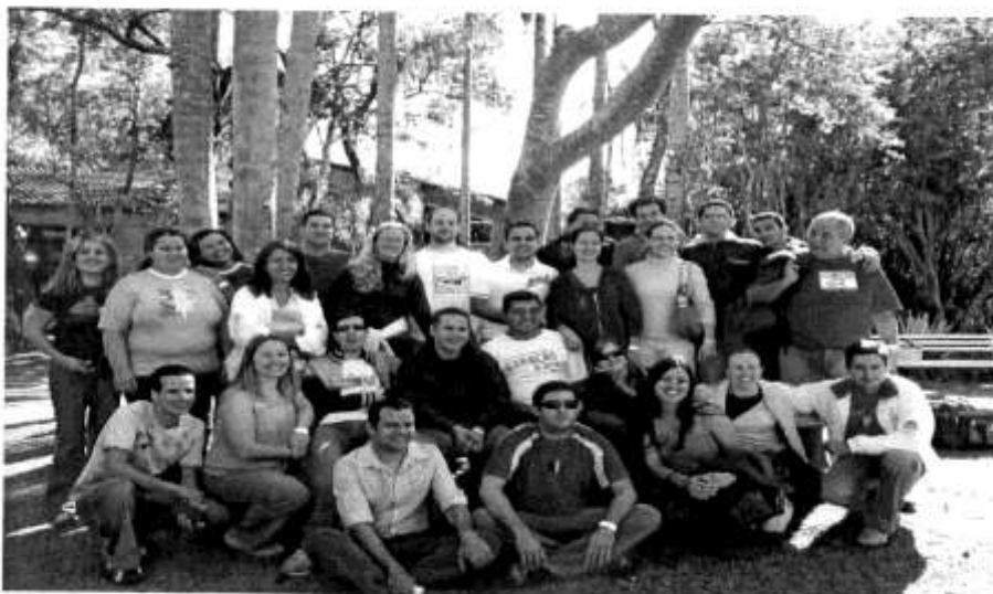
Foto Oficial da Reunião da Comissão Executiva da CNM em Cotia – SP – Agosto de 2006

Procurei atender carinhosamente os convites que recebi. Destaco a presença do Secretário na Confederação Noroeste do Brasil e na Federação de Mocidade do Presbitério Oeste Matogrossense, regiões que estão em pleno florescimento do trabalho de todas as Sociedades Internas.