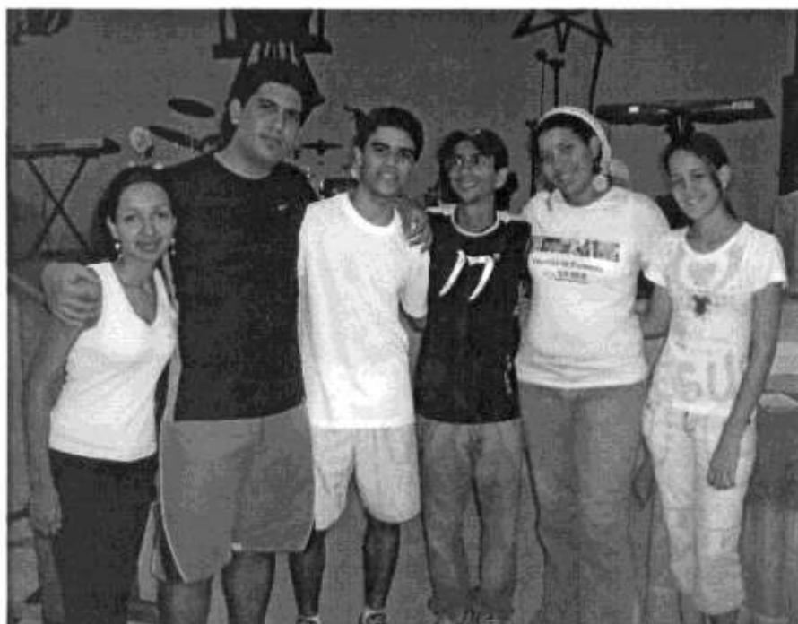
Executiva eleita 2007 da Federação Oeste Matogrossense, em Araputnga-MT, em Novembro de 2006