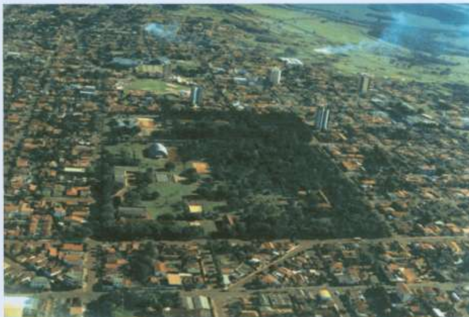
Vista aérea da Instituto Samuel Graham, é toda esta área verde, que ocupa 9 quarteirões na cidade de Jataí.