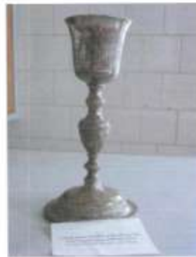
Cálice para Santa Ceia oferecido pelo imperador D. Pedro II à comunidade de Juiz de Fora