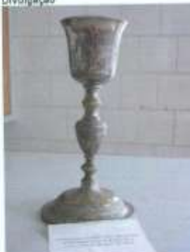
Cálice para Santa Ceia oferecido pelo imperador D. Pedro II à comunidade de Juiz de Fora