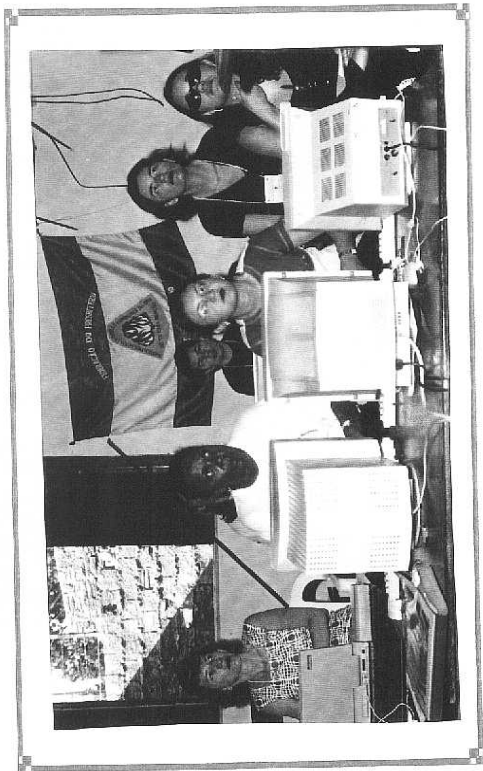
SAF do Futuro, Treinamento, Confederação Sinodal Maranhão.