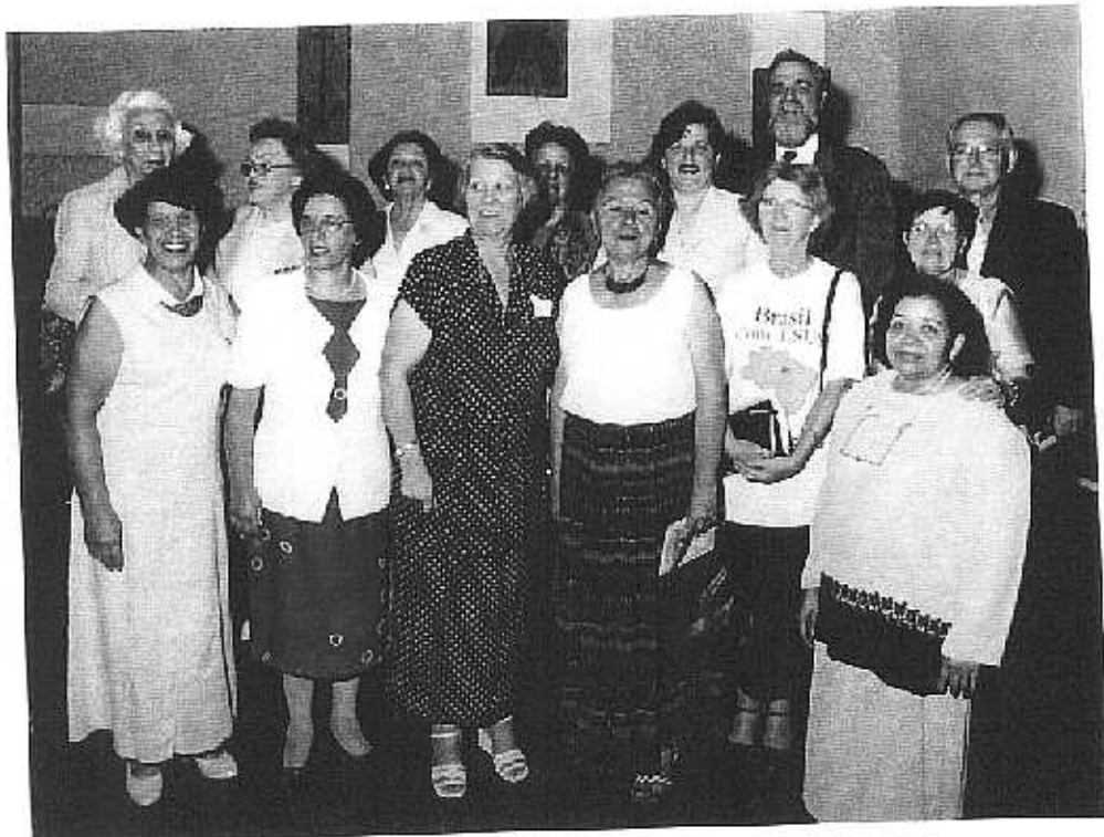
1ª Igreja Presbiteriana de Belo Horizonte, 116 anos da SAF.