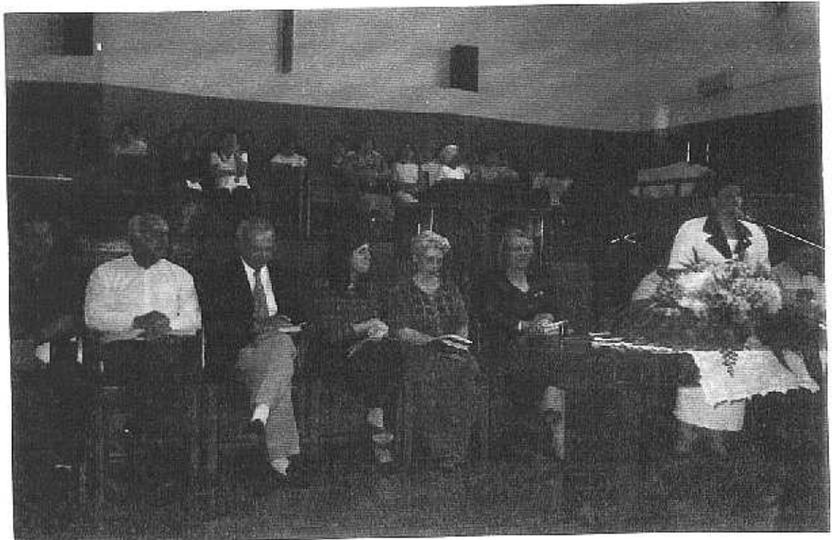
Federação Bauru, Confederação Sinodal Bauru