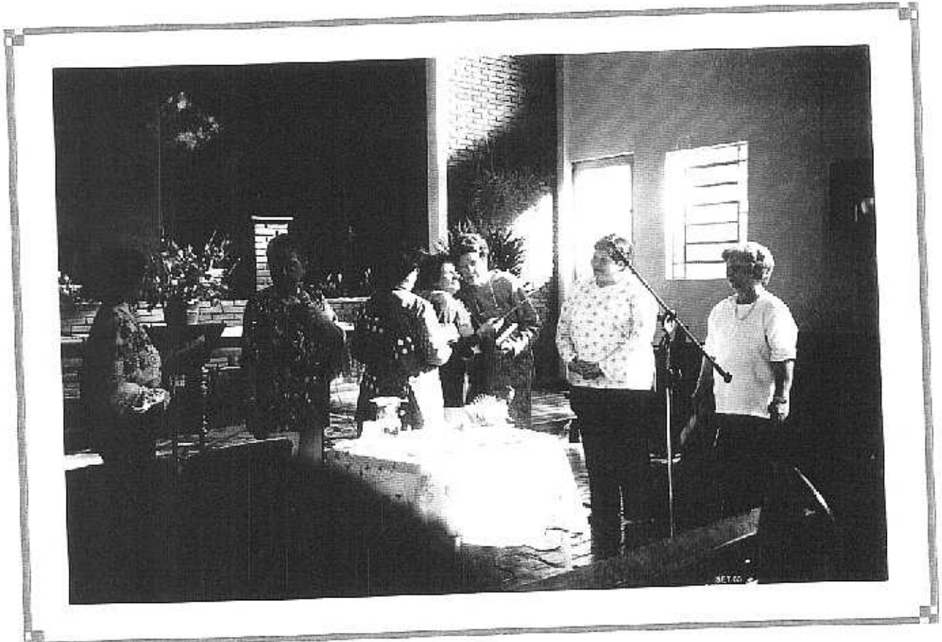
Federação Assis, Confederação Sinodal Sudoeste Paulista