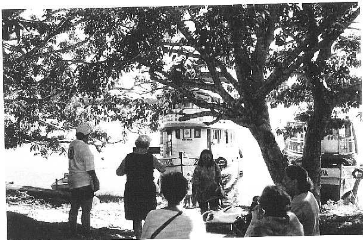
Viagem Missionária, Amazonas, Rio Negro, vista do Barco em que viajamos.