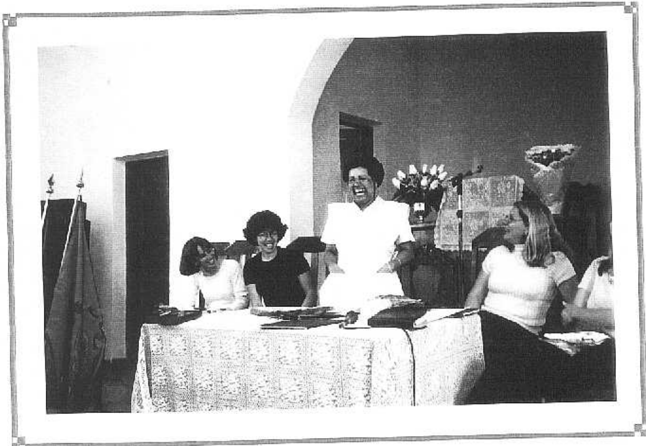
Federação Vale do Rio Pardo, Confederação Sinodal Moiana. SAF da Igreja Presbiteriana de Santo André, emergência de sócias