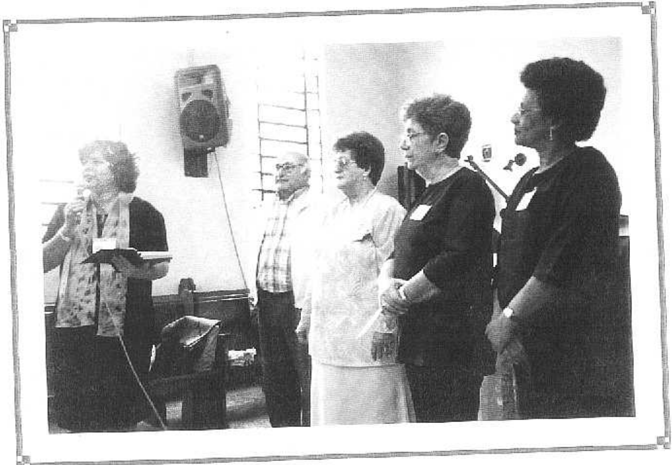
Federação Santo André, Confederação Sinodal Santos/Borda do Campo.