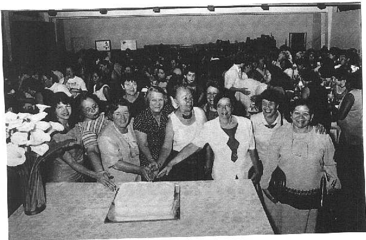
1ª Igreja Presbiteriana de Belo Horizonte, o bolo dos 116 anos.