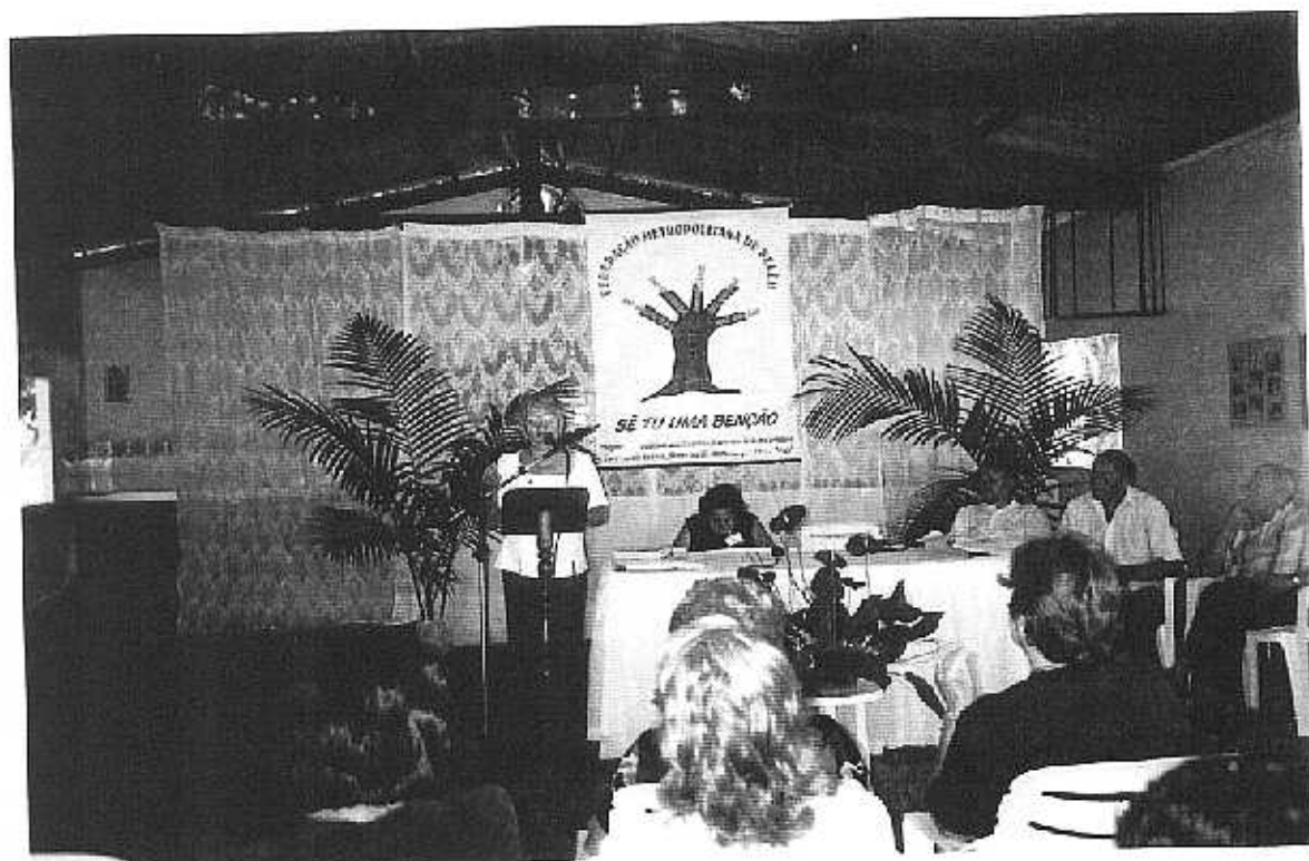
Confederação Sinodal Tropical, Encontro de Federação, Belém