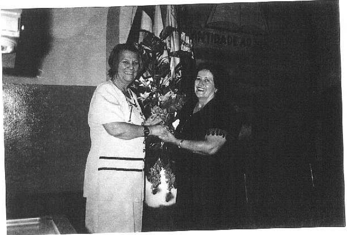
Reunião em Porangatu, Goiás.